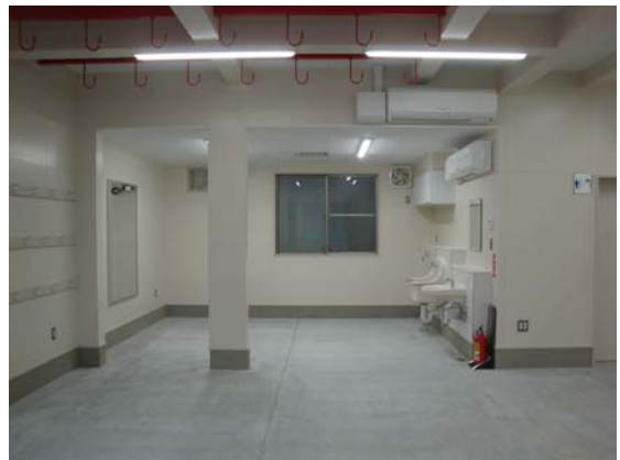
ウェイトトレーニングコーナー