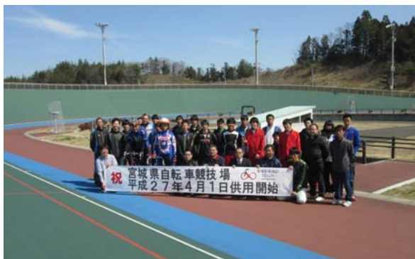
プロ・アマ参集による 供用開始記念写真