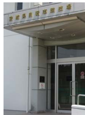
東日本大震災の甚大な被害(不陸、亀裂)より改築された走路