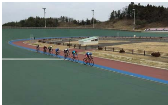
走路改築後の使用風景