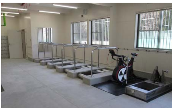
トレーニング室内（機器設置後）